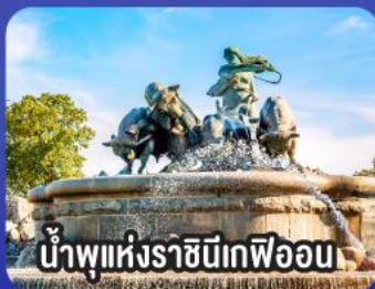
น้ำพุแห่งราชินีเกฟูน