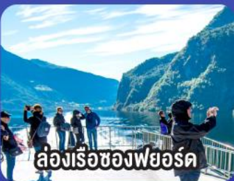
ล่องเรือช่องฟยอร์ด