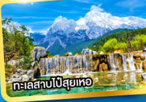
ทะเลสาบไป๋สฺยเหอ