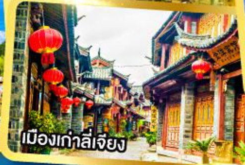
เมืองเก่าลี่เจียง