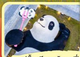
• รูปปั้นหมีแพนด้าเซลฟี่