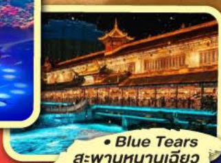
• Blue Tears สะพานหนานเฉียว