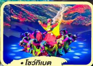
• โชว์ทิวเบต